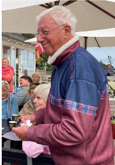
Bersærk Knud Laugstifter