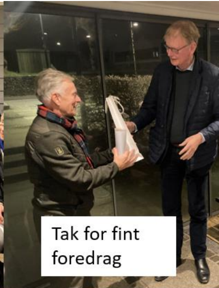
Tak for fint foredrag