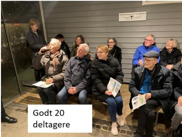
Godt 20 deltagere

Den drabelige hirschfænger indgik i fortællingen om Dyrehaven.